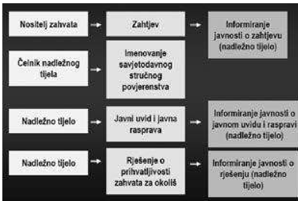
Slika 1: Shematski prikaz postupka obvezne PUO

U postupku ocjene o potrebi procjene utjecaja zahvata na okoliš javnost i zainteresirana javnost informira se o zahtjevu nositelja zahvata i rješenju donesenome u povodu zahtjeva nositelja zahtjeva. S druge strane u postupku izdavanja upute o sadržaju studije o utjecaju zahvata na okoliš javnost i zainteresirana javnost informiraju se o zahtjevu nositelja zahvata te o uputi donesenoj u povodu zahtjeva nositelja zahvata.