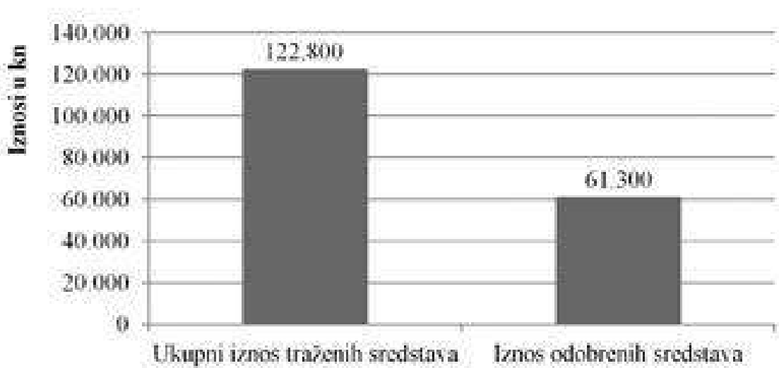
Grafički prikaz 1. Omjer sredstava potpore za e-knjigu

Od toga su za potporu prihvaćene 66 e-knjige (79,5%) s ukupnim odobrenim iznosom nepovratne potpore 61.300 kn, što je tek 49,9% od traženih sredstava (grafički prikaz 2). Od nakladnika koji su prijavili svoje programe za 23% njih nije odobren niti jedan naslov 46 . Raspon potpore po jednom naslovu kretao se u nekoliko razreda, od minimalnih 600 do maksimalnih 2.000 kn po pojedinom naslovu.