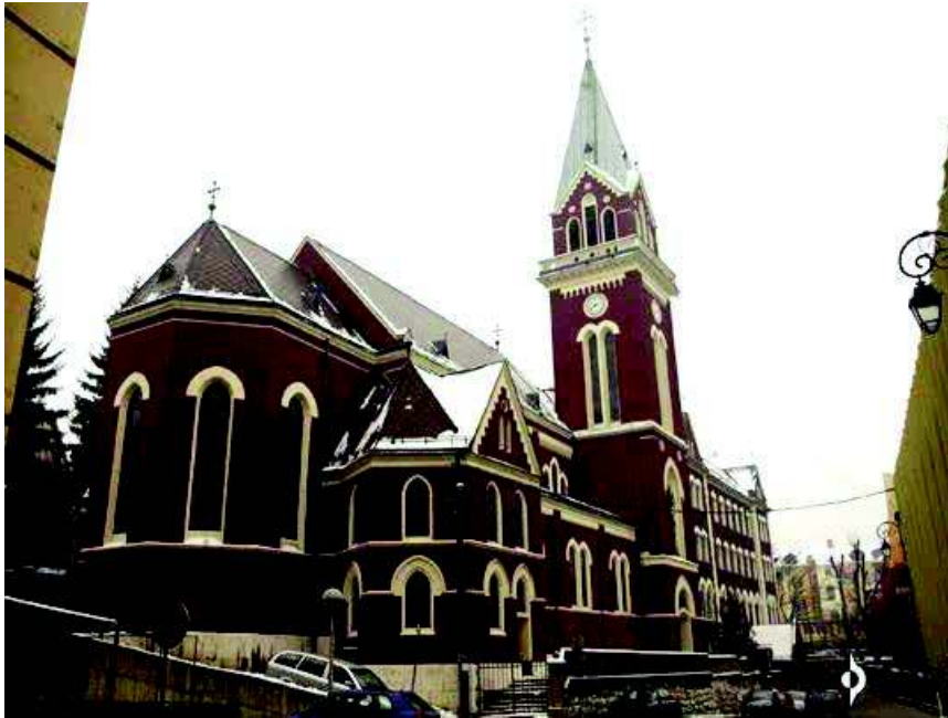
Slika 1. i 2. Crkva sv. Ante na Bistriku, Sarajevo